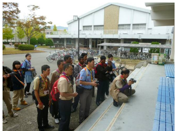
施設見学(武道場の前にて)