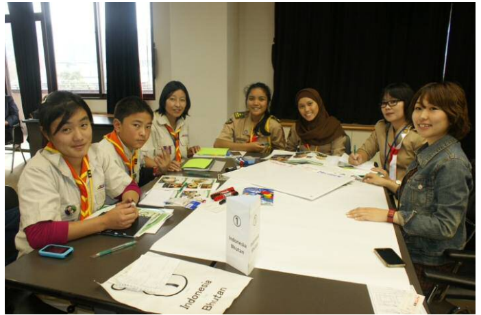
グループ①の課題は「マナー」でした