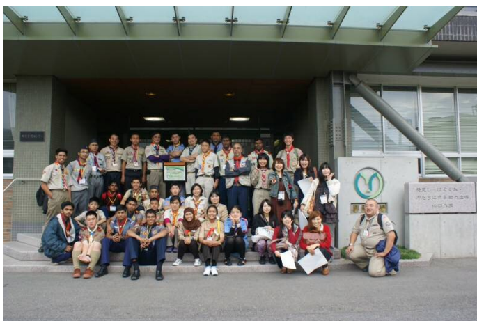
参加者全員そろっての記念撮影