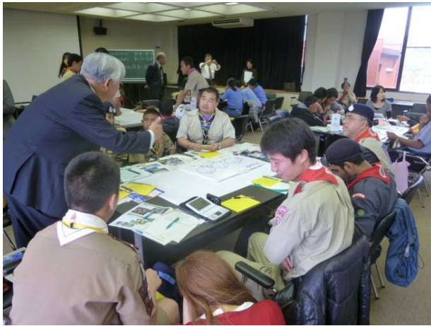
山口大学への質問も相次ぎました